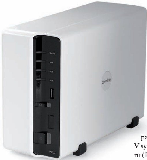
DS-207 silnější konstrukce skrývá dva SATA disky, které lze zkonfigurovat do pole RAID 0 nebo 1.

své PC). DS-107e a DS-207 dokáží fungovat jako servery pro obsah s iTunes a jako multimediální servery – prostě na jejich disk nahrajete mediální soubory, rozdělíte je podle vlastností na muziky, fotky a video a pak je můžete prezentovat na svém A/V systému pomocí Digital Media Adaptoru (DMA) - zařízení, schopného přenášet hudbu, fotky a video do vaší audio sestavy a na obrazovku televizoru.